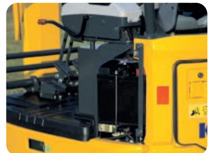
Linke Wartungsklappe: leichter Zugang zur Batterie