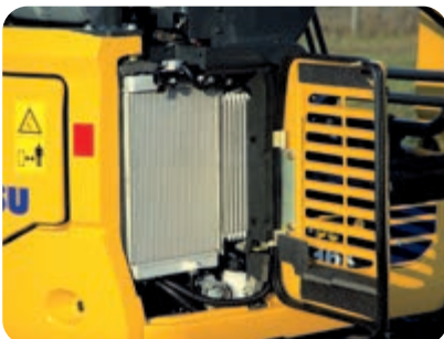
Rechte Wartungsklappe: einfacher Wartungszugang und leichte Reinigung der Kühler

Die Hydraulikleitungen sind dank ORFS-Kupplungen besonders gegen Leckage geschützt und bei Bedarf leicht auszuwechseln. DT-Steckverbinder sichern zuverlässige Verbindungen für die Elektrik. Ein Intervall von 500 h für das Abschmieren der Buchsen der Arbeitsausrüstung und des Schwenkwerks sowie ein verlängertes Motorölwechselintervall reduzieren Stillstandzeiten und Kosten.