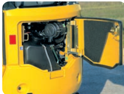
Hintere Wartungsklappe: schnelle Motorinspektion und Betankung