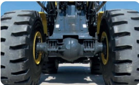
Verstärkte Achsen und verstärkter Frontrahmen