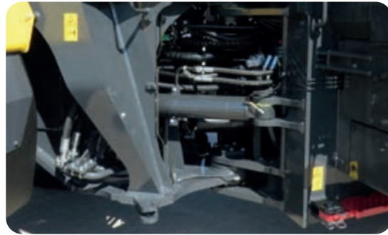
Verstärkter Bolzen im Knickgelenk, größere Lenkzylinder und angepasstes Hydrauliksystem