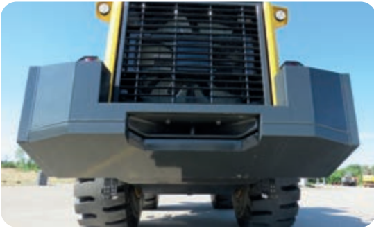
Schweres Gegengewicht (4975 kg)