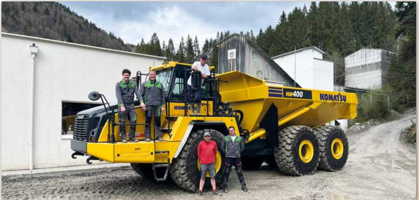
Der knickgelenkte Komatsu-Muldenkipper HM400-5 mit Heckklappe, seiner robusten Ausführung und modernster Achsaufhängung ist bei der Firma Moldan in Kuchl im Einsatz.