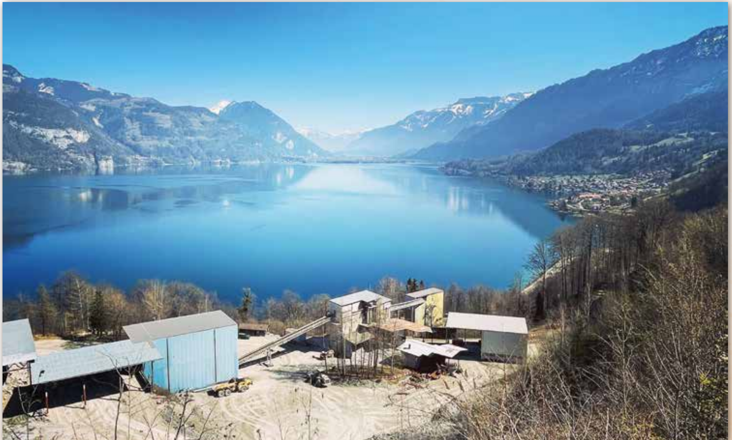
Selbst unwegsames Gelände oberhalb des Thunersees ist auch kein Problem für den HM400-5