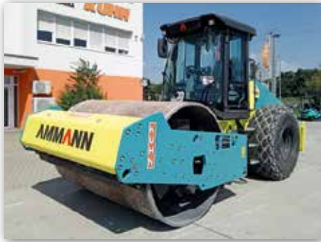
Ammann Walze ARS150 aufgerüstet mit ACE Force Compaction Measuring (Digitalisierte Dichtungsberichte für die Baustellen)

Wir wünschen der Familie Ács weiterhin viel Freude bei der Arbeit mit unseren Komatsu- und Ammann-Maschinen.