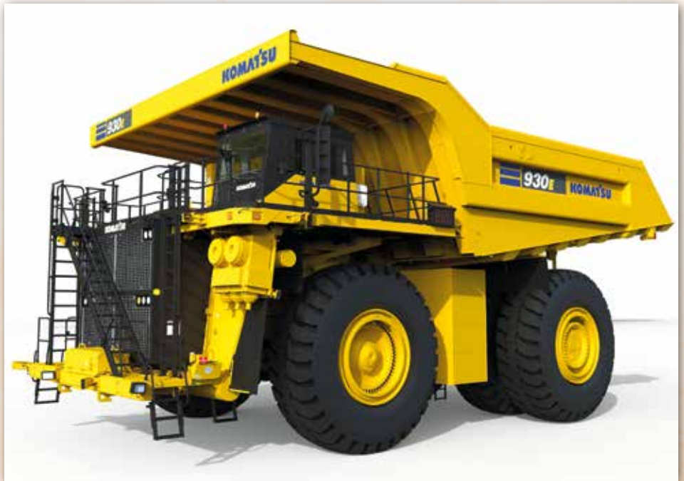
Der Komatsu 930E Muldenkipper, der zukünftig von Hydrotec-Brennstoffzellen angetrieben wird.

Diese Maschinen werden typischerweise über ihre gesamte Lebensdauer in einer einzigen Mine eingesetzt, was die Dimensionierung und Einrichtung einer Wasserstoff-Tankinfrastruktur für die Maschinenflotte vereinfacht. Der Wasserstoffbetrieb von Muldenkippern von Komatsu wird für die Dekarbonisierung eine Alternative zu mobilen Batterieladegeräten oder festen Ladestationen darstellen, denn es muss keine zusätzliche Lade-Infrastruktur in der Mine installiert werden. Komatsu hat sich zum Ziel gesetzt, seine