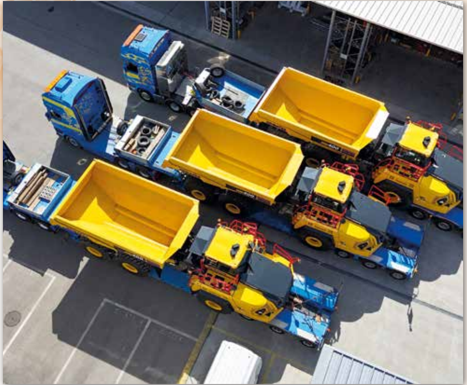
Drei knickgelenkte Muldenkipper HM400-5 standen Ende Mai zur Auslieferung bereit

Die Entscheidung von VIGIER Beton für die knickgelenkten Muldenkipper von KOMATSU wurde maßgeblich durch den hohen Fahrkomfort und die herausragende Zuverlässigkeit der Fahrzeuge beeinflusst, besonders in unwegsamem Gelände. Dies ist von besonderer Bedeutung für die anspruchsvollen Einsatzorte, beispielsweise oberhalb des Thunersees, wo die Bedingungen oft extrem herausfordernd sind.