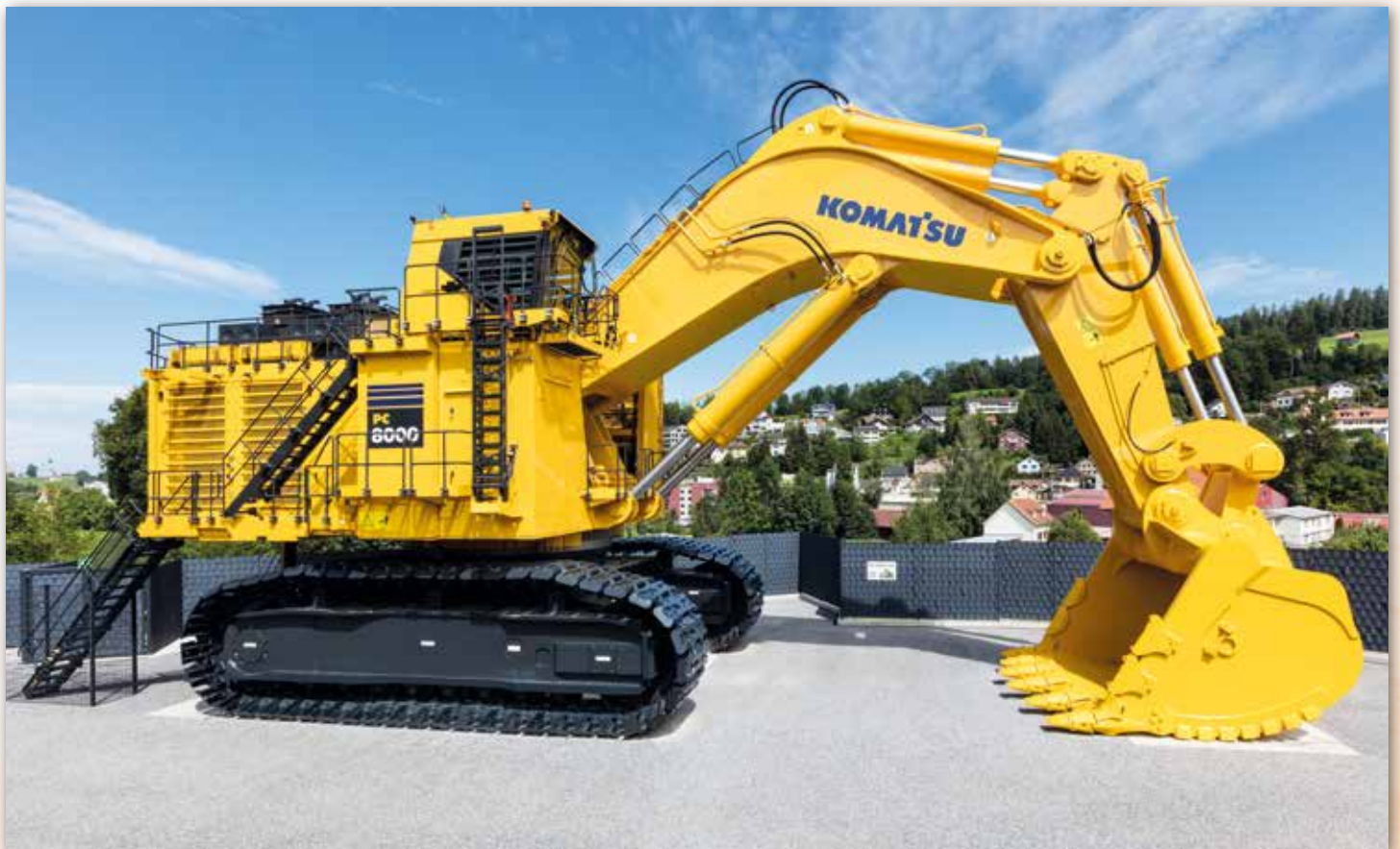
PC8000 (800 t Betriebsgewicht)