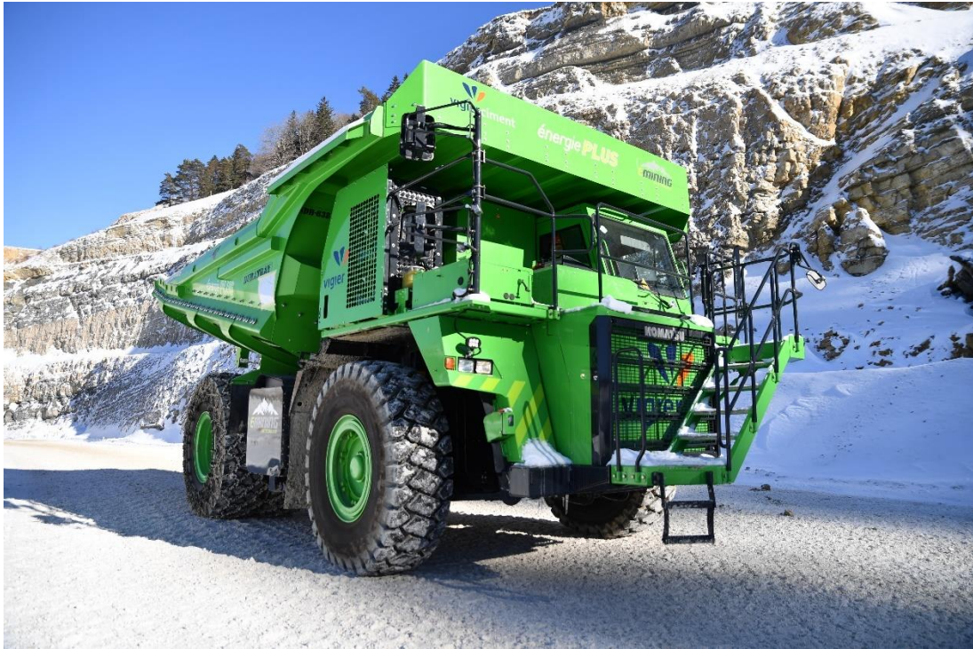
Kuhn Schweiz AG: Der größte batteriebetriebene Muldenkipper der Welt ist auch mit einem eindrucksvollen Foto im Guinness-Buch der Rekorde 2022 abgebildet. Der E-Dumper kann als Plusenergie-Fahrzeug eingesetzt werden. Beim Betrieb wird gleichzeitig CO 2 -freier Strom erzeugt.