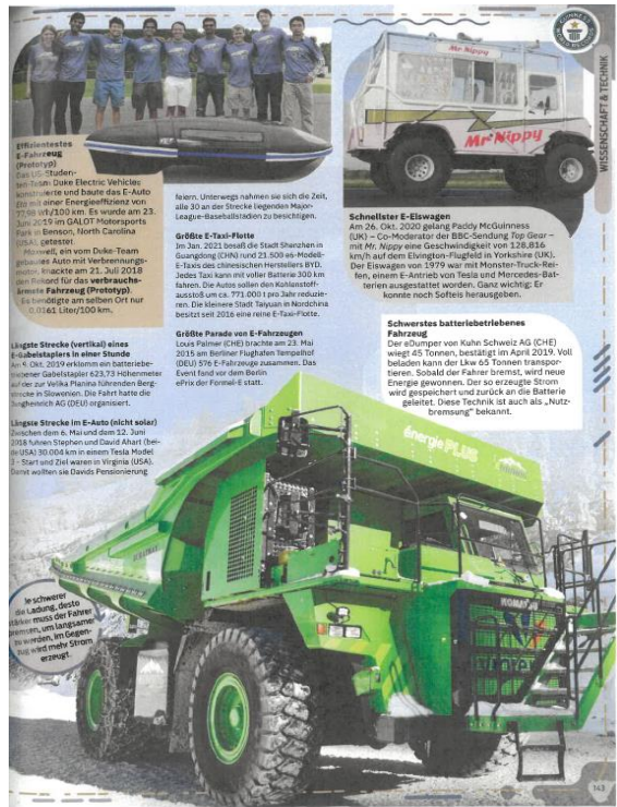
Eine der kultigsten Herausgaben zum Schmökern und Staunen: Das Guinness-Buch der Rekorde.